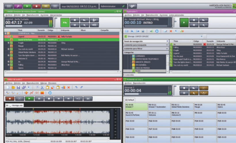
Interfaz de Hardata Hdx Radio 3, amigable e intuitiva.